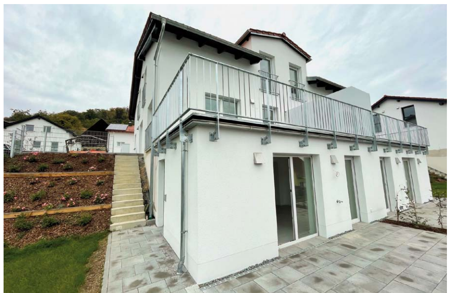
Die fertigen Doppelhaushälften liegen in attraktiver Hanglage mit Blick in Richtung Naab.

Im Jahr 2014 hatte der Teublitzer Stadtrat den Beschluss gefasst, das Baugebiet „Schlosszelläcker“ aufzustellen. Einige Jahre später, nämlich 2018, erwarb die „Gewerbepark Neunburg GmbH“ mehr als die Hälfte der Grundstücke. Dies umfasste nahezu