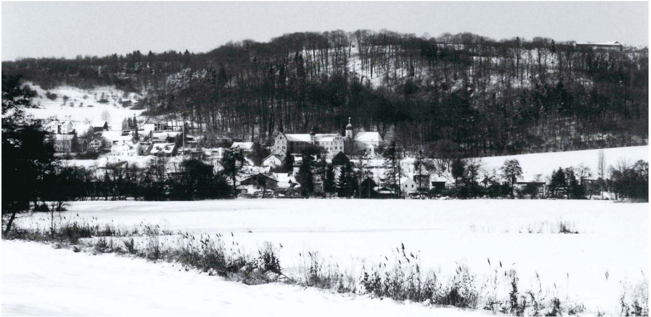
Blick in Richtung des Schlosses im verschneiten Teublitzter Ortsteil Münchshofen.