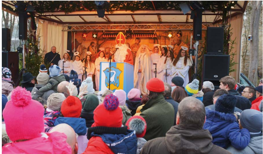
Beim Besuch des Nikolauses am Weihnachtsmarkt-Sonntag herrscht großer Andrang bei den Kleinen.

Während auf der Bühne durch die zahlreichen Bands und Acts immer etwas geboten ist, gibt es in der Budenstadt rund um die Uhr ebenso lebhaftes Treiben. Vielleicht findet sich auch das ein oder andere Weihnachtsgeschenk bei den zahlreichen Kunsthandwer-