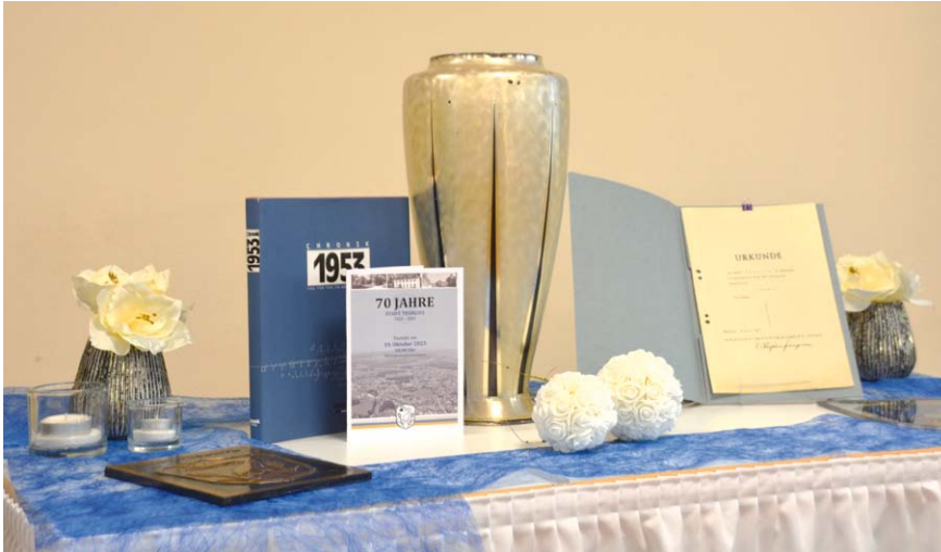
Ausstellungsstücke aus der Teublitz Geschichte und die Stadterhebungsurkunde gab es zu bestaunen.