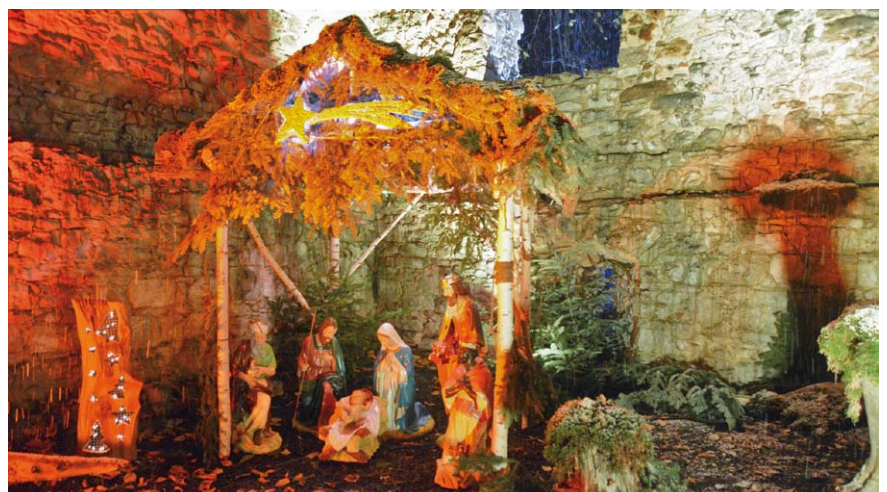
Die liebevoll und detailreich gestaltete Krippe in der Schlossruine wartet auch dieses Jahr wieder auf die Weihnachtsmarkt-Gäste.

Abwechslungsreiches Bühnenprogramm für jeden Geschmack Bereits um 14:00 Uhr öffnet der Weihnachtsmarkt am Sonntag seine Tore und lädt auf weitere gemütliche Stunden in den Teublitzer Stadtpark ein. Zugleich zeigen die Tanzsportabteilung „Fantasie“ des SC Teublitz und