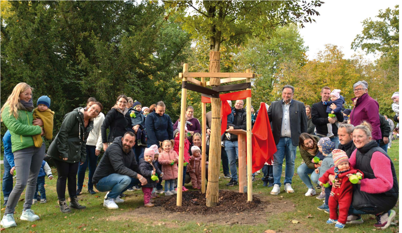
Großer Andrang bei der Enthüllung der Plakette beim Baum für den geburtenstarken Jahrgang 2022.