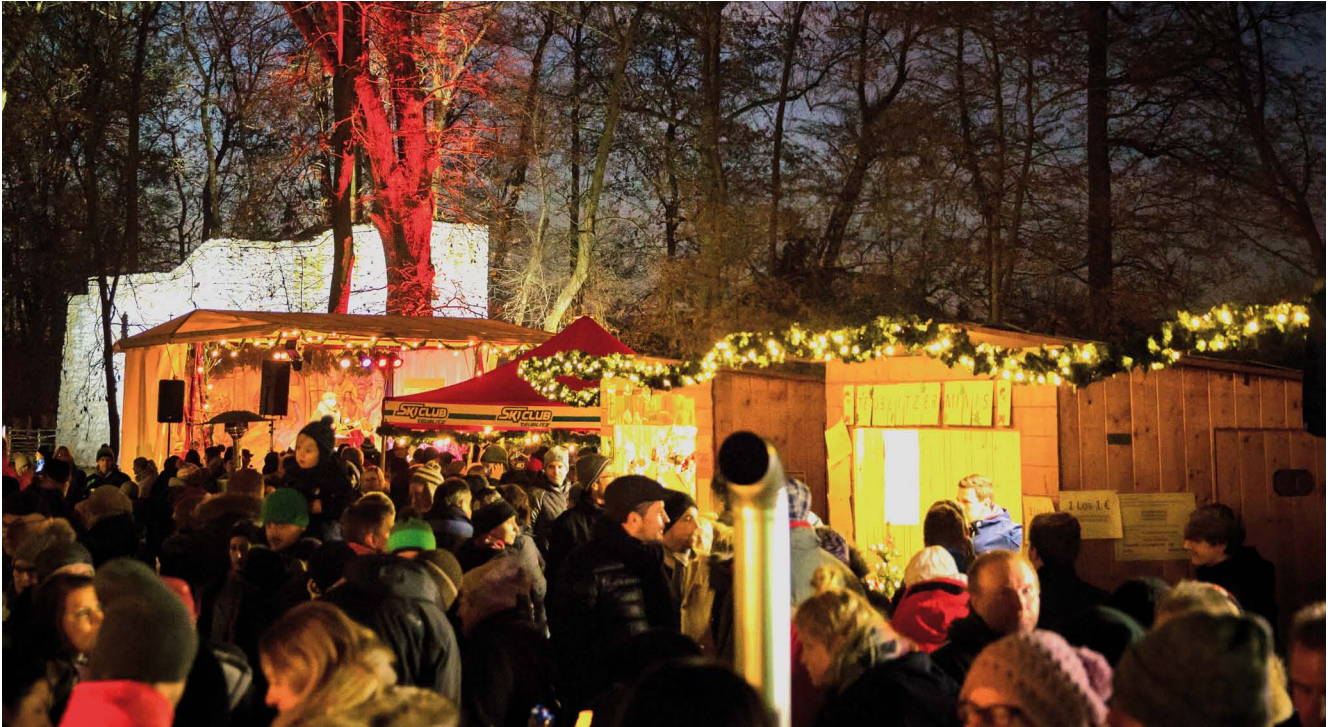
Der Teublitzer Weihnachtsmarkt lockt mit einem breiten Angebot und romantischem Flair.