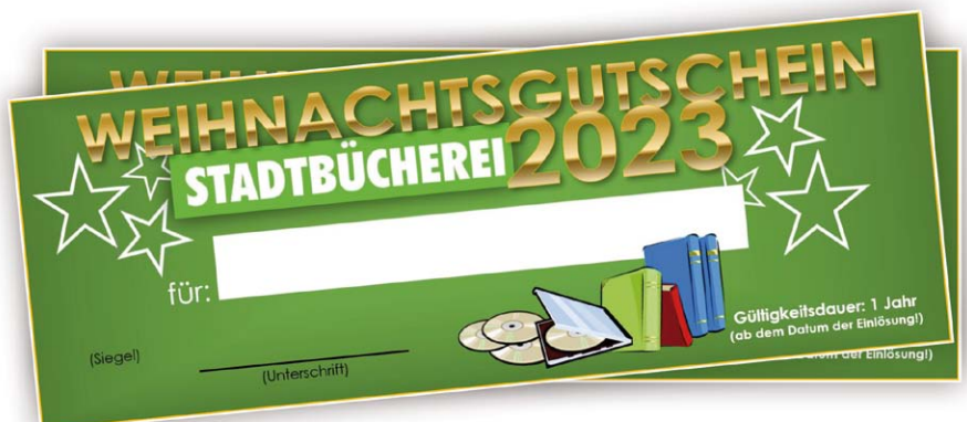
Eine tolle Geschenkidee zu Weihnachten: Der Weihnachtsgutschein der Stadtbücherei Teublitz. (Grafik: Thomas Stegerer)

Weihnachten naht und noch keine Geschenk-Idee? Der Weihnachtsgutschein der Stadtbücherei wäre in diesem Fall eine der optimalen Lösungen. Damit erhalten Beschenkte „ein Gratis-Jahr“ Mitgliedschaft in der Stadtbücherei. Dadurch gibt es den vollen Zugriff auf jegliche Medien, seien es Bücher, Spiele, eBooks, Magazine oder der Streaming-Dienst „filmfreund“ – mit einem Gutschein ist alles dabei! Die Gutscheine sind ab sofort in der Stadtbücherei erhältlich: Also, worauf noch warten?