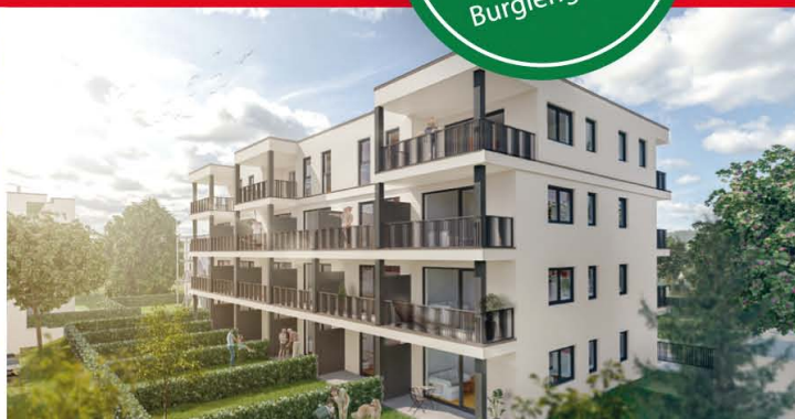
BURGLENGELFELD · Eigentumswohnungen