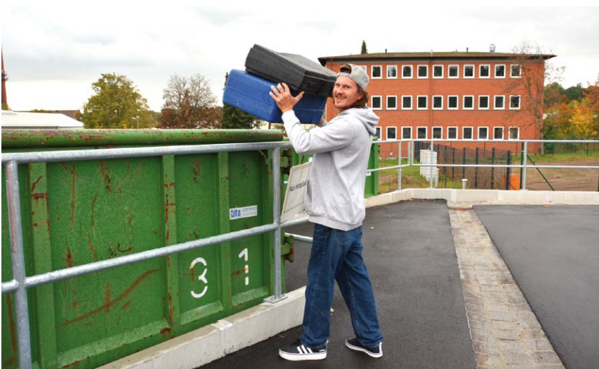
Der erste Einwurf in die neuen und abgesenkten Container am interkommunalen Recyclinghof.

sehr gut angenommen wird. Geplante Entleerungen der Container durch die Firma Lober wurden bereits auf drei bis vier Mal wöchentlich aufgestockt. Bereitgestellte Elektrobehälter mussten aufgrund des hohen Anlieferungsvolumen gegen einen noch größeren Container getauscht werden.“ Auch die verlängerten Öffnungszeiten zeigen ihre Wirkung. „Insbesondere am Abend hat die Einrichtung einen enormen Zulauf. Stoßzeiten am Wochenende konnten so bislang vermieden werden“, ergänzt Hauser.