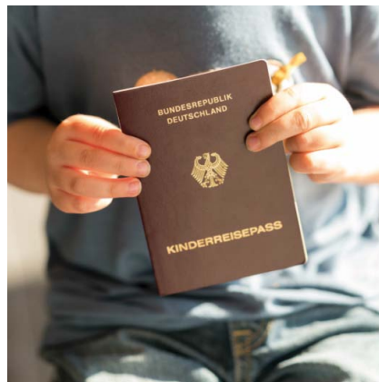
Der bisher bekannte und gerne beantragte Kinderreisepass ist ab dem 1. Januar 2024 ein Auslaufmodell.

Ausweisdokumente für Kinder sind nach denselben Normen konzipiert wie Ausweisdokumente für Erwachsene. Dazu gehört die Ausstattung mit einem Chip, wenn Ausweisdokumente mehrere Jahre gültig sein sollen. Der Chip enthält unter anderem elektronische Sicherheitsmerkmale, welche