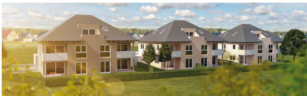
TEUBLITZ-KATZDORF · Einfamilienhäuser, Doppelhaushälfte und Eigentumswohnungen