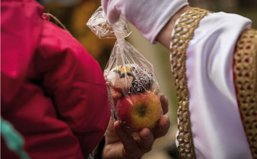
Bislang waren Kinder den Besuch des Nikolauses am Weihnachtsmarkt gelohnt – dieses Jahr schaut er zweimal in Teublitz vorbei – am 4. Dezember um 16 Uhr im Jugendtreff!