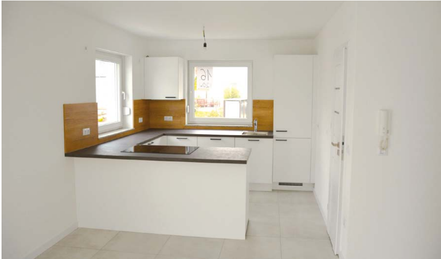
Bereits vorhandene Einbauküchen sind in den Mietshäusern inklusive.

den kompletten unteren und mittleren Bereich des Gebiets. Das erklärte Ziel der Firma ist es, bezahlbaren Wohnraum in schöner Lage zu schaffen. Was folgte waren zähe Baufortschritte, verschuldet durch an Ort und Stelle tätige Baufirmen aus dem Ausland, die ihrem Handwerk nicht mächtig schienen. Hinzu kamen die COVID-19-Pandemie und der Krieg in der Ukraine, welche ebenfalls zu langen Pausen und Lieferengpässen am Bau führten.