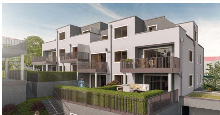
NABBURG · Eigentumswohnungen