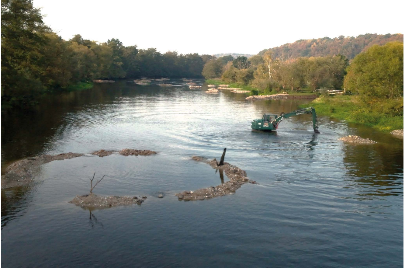
Mit einem Spezialbagger wurde der Fluss im Sommer und Herbst 2023 umgestaltet.