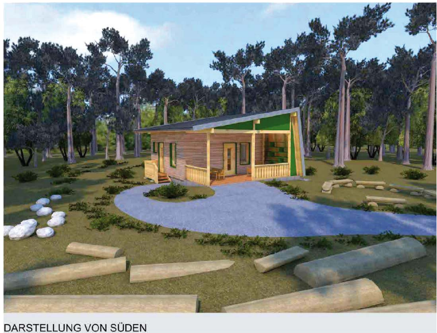
DARSTELLUNG VON SÜDEN

Als Parkmöglichkeit für die Eltern soll der hintere Bereich des vorhandenen Parkplatzes in der Nähe der „Holzspitzkurve“ dienen. Von hier aus bringen die Eltern ihre Kinder zu Fuß zum Sammelpunkt. Dort soll ein zweigeteiltes Warte-