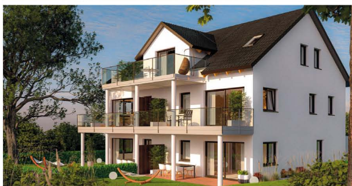
REGENSBURG · Eigentumswohnungen