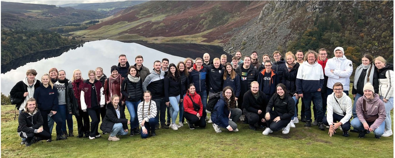
Die Reisegruppe erklimmt während der Jugendbildungsfahrt den größten Nationalpark Irlands, die Wicklow Mountains.