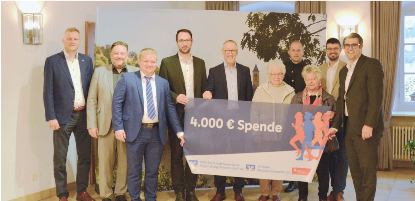
Vertreter*innen der Städte Maxhütte-Haidhof, Burglengenfeld und Teublitz, sowie der drei spendenden Banken und der Tafel trafen sich beim Rathaus in Burglengenfeld zur Spendenübergabe.