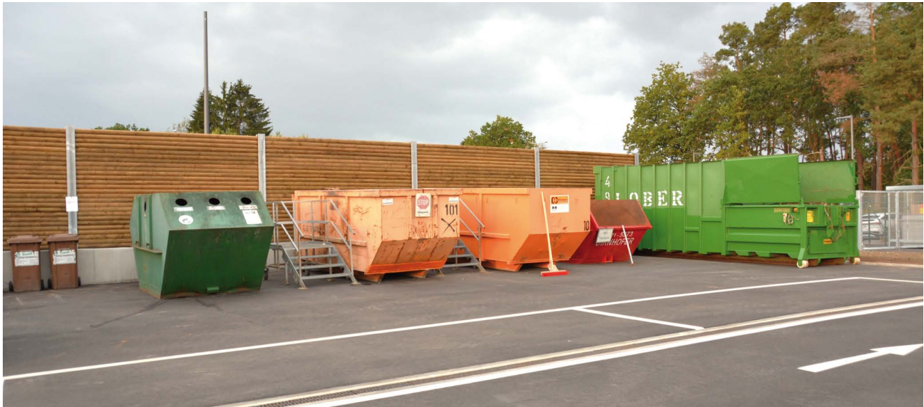
Neben den abgesenkten Entsorgungscontainern gibt es weitere Container und eine neue Kartonagenpresse.