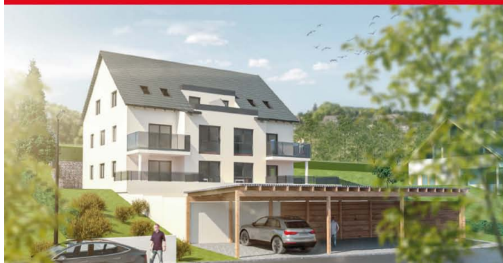
NITTENDORF · Eigentumswohnungen