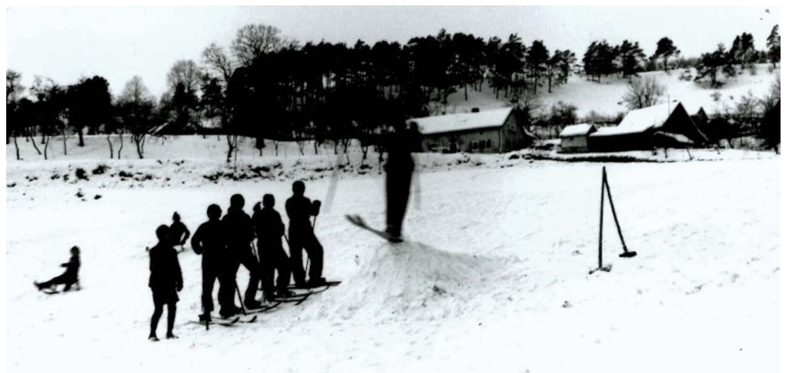
Vor vielen Jahrzehnten beschäftigten sich Sportbegeisterte in Münchshofen über die Freuden des Wintersports.