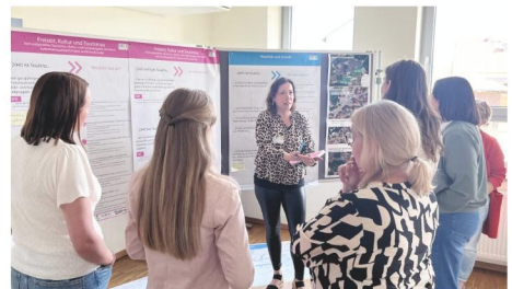
Abb.2 Erste öffentliche Bürgerwerkstatt im September 2025