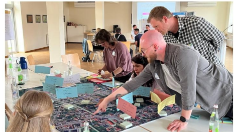
Abb. 1 Einblick Fachworkshop im Mehrgenerationenhaus im April 2026

Zu Beginn der Veranstaltung stellen die beauftragten Planungsbüros den aktuellen Arbeitsstand des ISEK vor. Darüber hinaus werden die beiden Schwerpunktthemen „Entwicklung der Teublitzler Mitte“ und „Verkehrssituation in Teublitz“ näher erläutert.